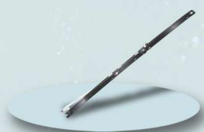
CONJUNTO MECANISMO COM SUPORTE